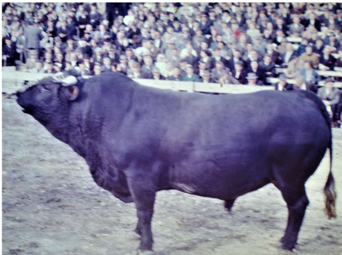
Rainier lors de l'Expo Nationale 1964